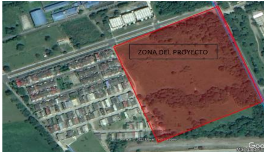
Imagen 1 Localización del proyecto