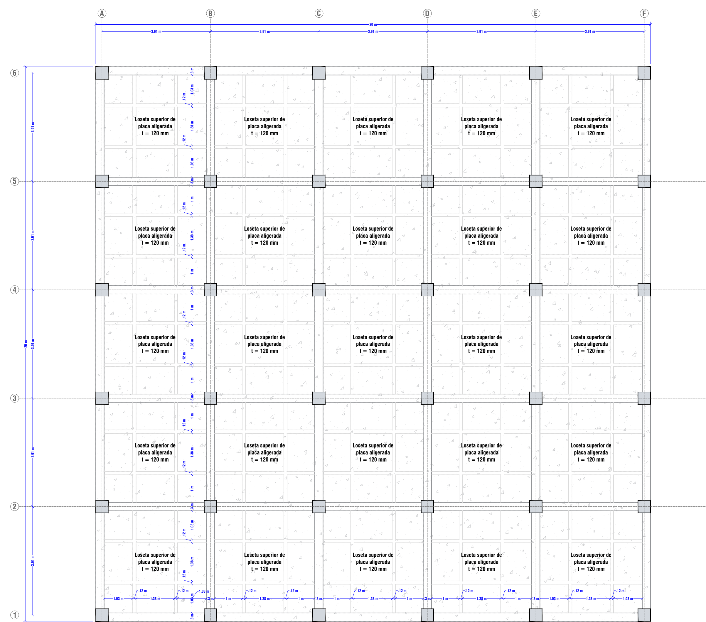
PLACA SUPERIOR DE TANQUE N + 6.00 (TAPA) Vista en planta Escala 1:100