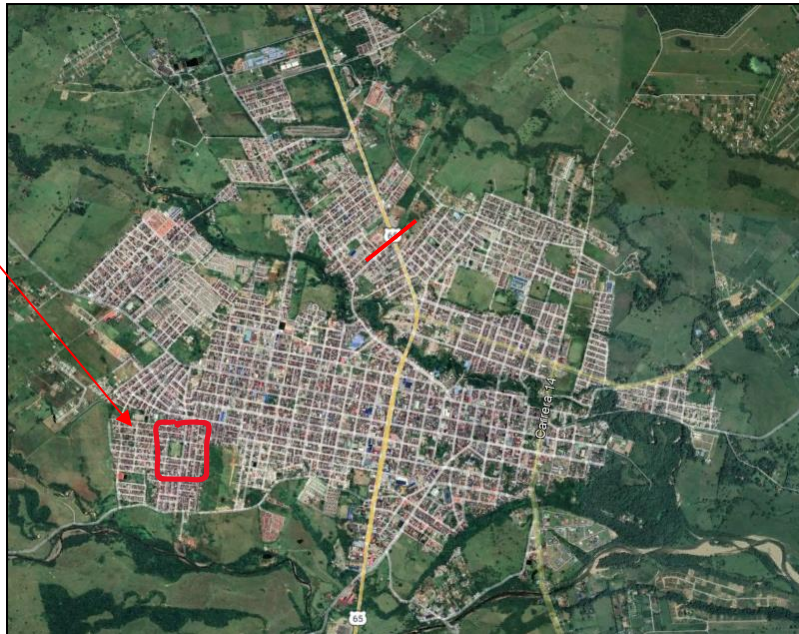
Figure 2. Sector a intervenir barrio independencia y villa del llano