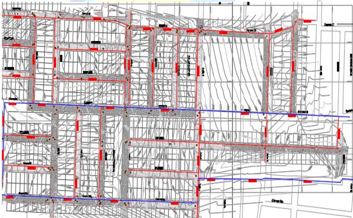
Figure 1. Barrio a intervenir independencia

Las obras proyectadas a realizar están localizadas en las siguientes direcciones: carrera 36ª y carrera 36b entre calle 6 y calle 6ª; calle 6ª, calle 7, calle 8, calle 8ª, calle 8b y calle 9 entre carrera 37 y carrera 36; Carrera 36 a y carrera 36b entre calle 7 y calle 8; carrera 35ª y carrera 35 entre calle 6 y calle 6; calle 7ª y calle 7b entre carrera 34 a y carrera 6; carrera 35ª y carrera 35 entre calle 8 y calle 9; carrera 34ª entre calle 6 y calle 9, y sumideros sobre la carrera 29 entre diagonal 15 y avenida 23.